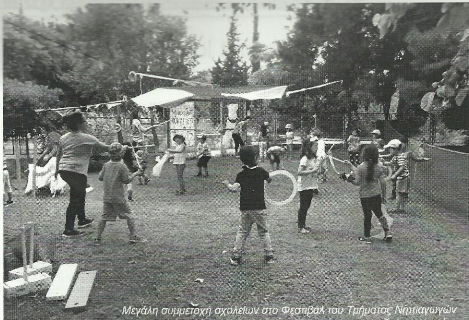
Μεγάλη συμμετοχή σχολείων στο Φεστιβάλ του Τμήματος Νηπιαγωγών